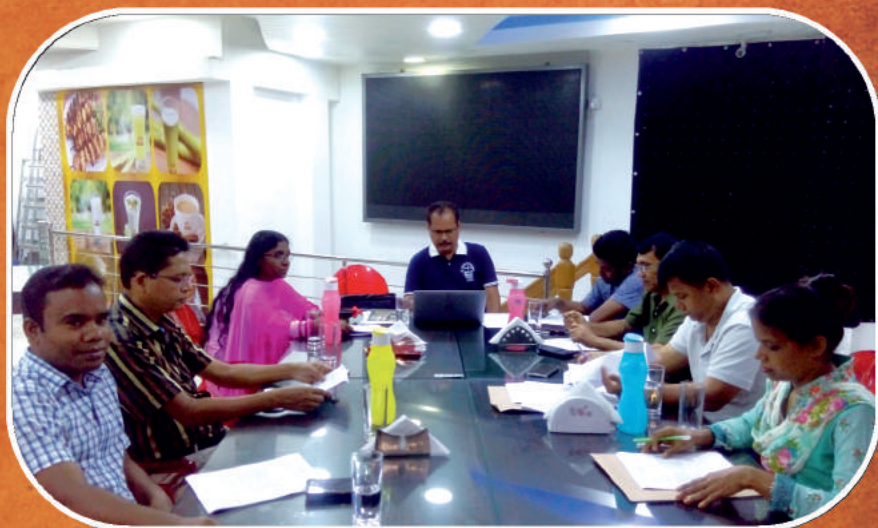
ASI Board Members